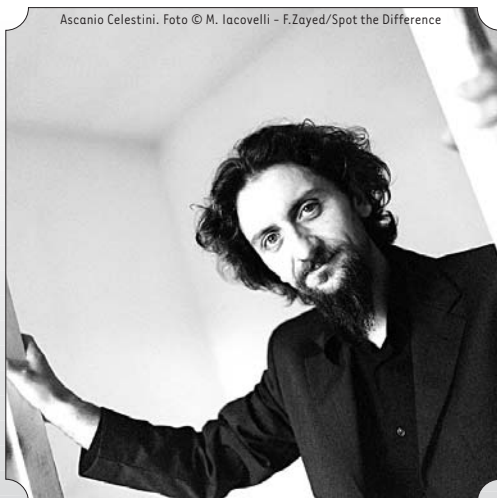
Ascanio Celestini.

Inizia così Celestini, con una divertente malinconia dei "favolosi anni '60". L'attore poi diventa un bambino, Nicola, che vive con la nonna, e la sua storia si mescola a quella di un altro bambino, guardiano di un gregge di pecore. I due, da grandi, stanno sempre insieme nell'ospedale psichiatrico dove sono ricoverati. Nicola è in cura da 35 anni, e con la voce di Celestini racconta il suo passato da "libero", in quegli anni '60 favoleggiati all'inizio, tra ricordi pittoreschi e surreali della nonna (che girava sempre scalza e a tutti